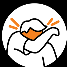
In Taschentuch oder Armbeuge husten und niesen.