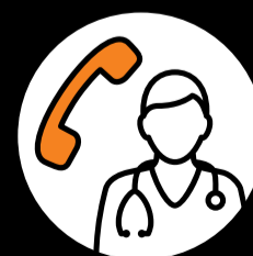
Nur nach telefonischer Anmeldung in Arztpraxis oder Notfallstation.