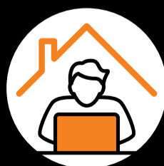
Falls möglich weiter im Homeoffice arbeiten.