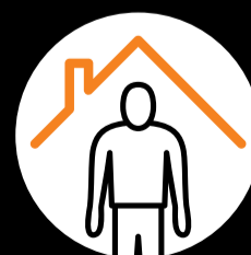
Bei Symptomen zuhause bleiben.