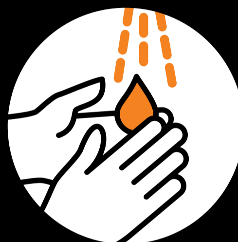
Gründlich Hände waschen.