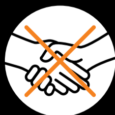
Hände schütteln vermeiden.