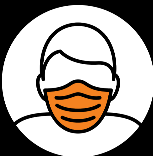
Maskenpflicht im ganzen Kino.